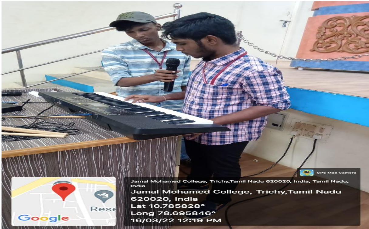
ஒரு மாணவர் கீபோர்டு வாசிக்கும் காட்சி...