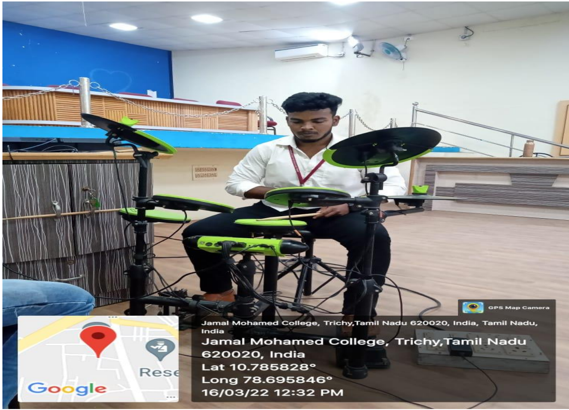
ஒரு மாணவர் டிரம்ஸ் அடிக்கும் காட்சி..